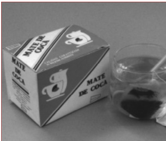
Een goede deal: een duurzaam drugbeleid in noord en zuid

Er zijn verschillende toepassingen waarin consumenten in Europa zouden kunnen genieten van de heilzame werking van coca: bijvoorbeeld in thee, extracten, zalf, tandpasta, frisdrank. Personen die ooit in de Andes hebben gereisd of op een andere manier met de werking van coca in contact zijn gekomen, hebben aan den lijve ondervonden dat deze als remedie kan gelden voor vele kleine en grote kwalen: verkoudheid, griep, zwaarlijvigheid, hoofd- en darmklachten, lusteloosheid, huidklachten, spier- en kiespijnen etc. 2