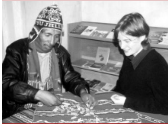
Het gebruik van coca in een Westerse context zou een brug kunnen slaan tussen verschillende culturen.

Om vrij op de internationale markt te opereren, hoeft men zelfs niet alle cocaïne uit de cocaproducten te ver-