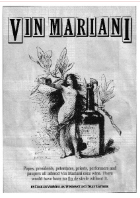
Aan het einde van de 19e eeuw was de Vin Mariani, een wijn op basis van cocabladeren, een populaire drank bij de toenmalige jet-set.